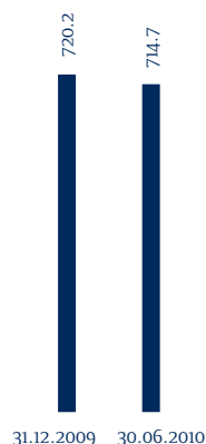
Personalbestand (teilzeitbereinigt, ohne Praktikanten)